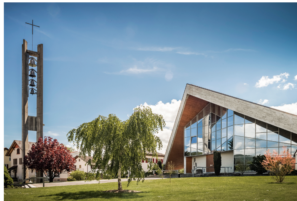
Welche Rolle spielen die Leitsätze , wenn die Denkmaleigenschaft nicht auf den ersten Blick klar ist? | Quel rôle les Principes peuvent-ils jouer lorsque la valeur historique d'un monument n'est pas évidente de prime abord? Eglise Notre-Dame du Rosaire, Vicques (JU), architecte Pierre Dumas, ingénieur Heinz Hossdorf, 1961.