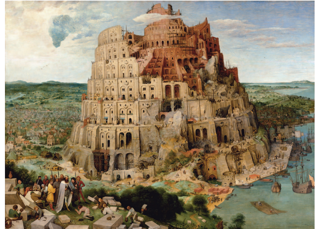
Pieter Bruegel d. Ä., Turmbau zu Babel, 1563