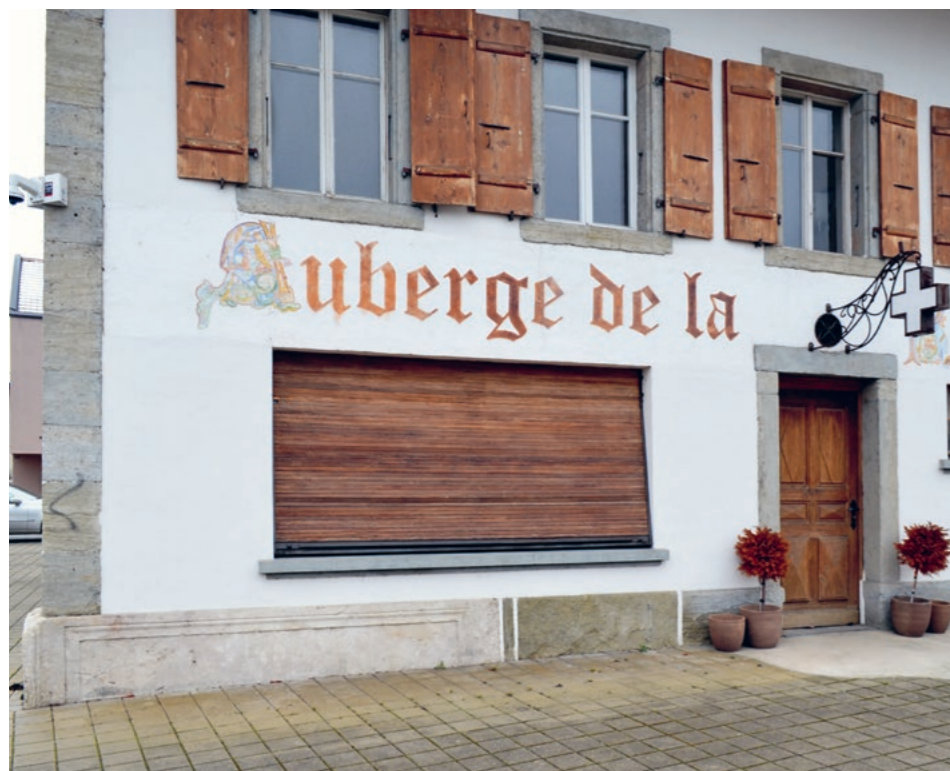
Fig. 3 et 4 : Pilastre en calcaire urgonien en emploi dans l'angle nord-est de l'Auberge de la croix blanche à Domdidier.