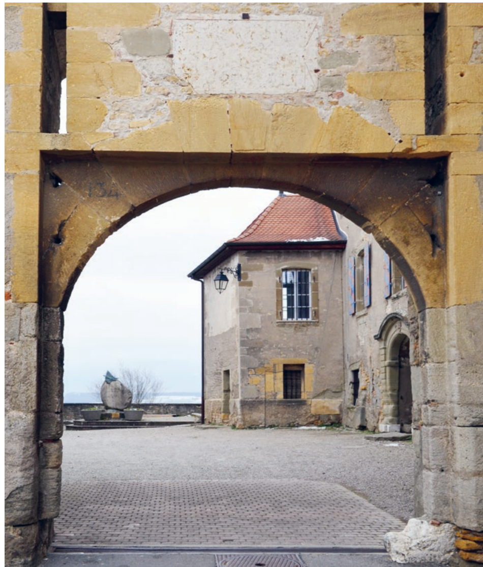
Fig. 2 : Inscription antique surplombant la porte sud du château d'Avenches.