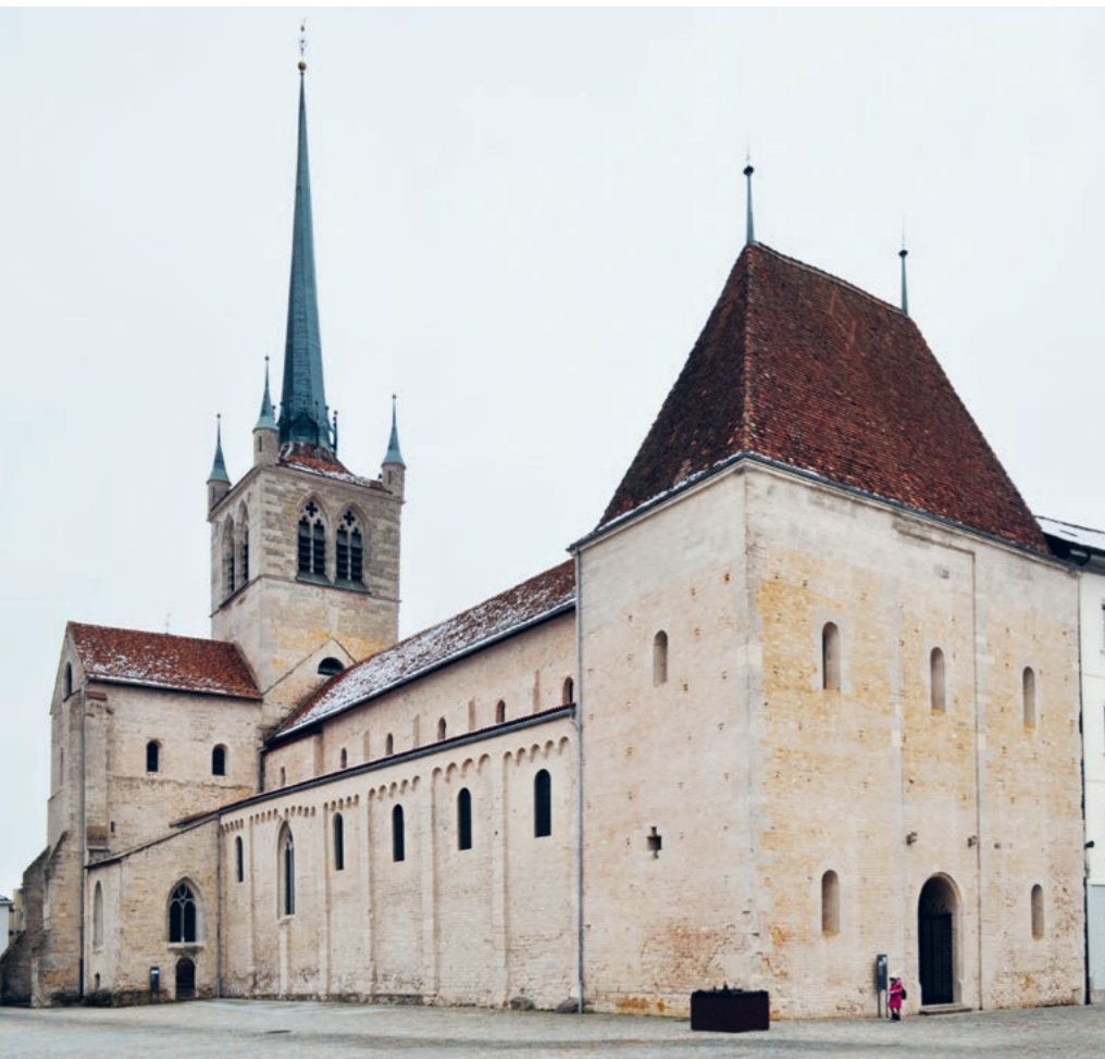
Fig. 7 : Moellons en calcaire jaune en emploi dans l'Abbatiale de Payerne.

De nos jours, la plupart des gisements antiques étant épuisés ou n'étant plus exploités, il n'est plus possible d'y extraire les matériaux nécessaires aux travaux de restauration des principaux monuments de la ville romaine. Comme il n'est, fort heureusement, plus envisageable de démanteler un monument pour en restaurer un autre, l'approvisionnement en pierre (calcaire jaune et grès coquillier) doit se faire dans des carrières, certes plus éloignées, mais dont les matériaux présentent les caractéristiques pétrographiques les plus proches des roches utilisées pendant l'Antiquité 5 . Ainsi, le grès coquillier provient des carrières de Mägenwil (AG) et le calcaire jaune neuchâtelois a été remplacé par la pierre de Jau-mont (ou calcaire de Metz) issue de Moselle (France).