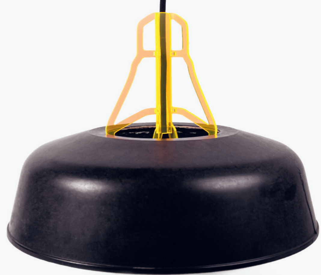
Durch die Kombination des makellosen Plexiglas und des Lampenschirms mit seinen Altersspuren ist ein zeitgemäß wirkendes Designobjekt entstanden, das noch lange seinen Zweck erfüllen wird. Carolina Fincke, Reflektor, Reparaturkurs an der Hochschule für angewandte Wissenschaften München, 2017/18.

sind sie selbstverständlich objektinhärent. Denn auch sie bleiben indirekt erhalten, wenn anerkannte bzw. (rechts-)gültige Denkmalwerte direkt greifen und das Objekt daher bestehen bleiben muss. Diesem Sachverhalt wird auch in den Leitsätzen zur Denkmalpflege in der Schweiz Rechnung getragen: «Das Erhalten originaler Denkmalsubstanz als bedeutsame und nicht erneuerbare Ressource hat Vorrang vor dem Maximieren einer ökonomisch oder ökologisch verstandenen Nachhaltigkeit.» 7