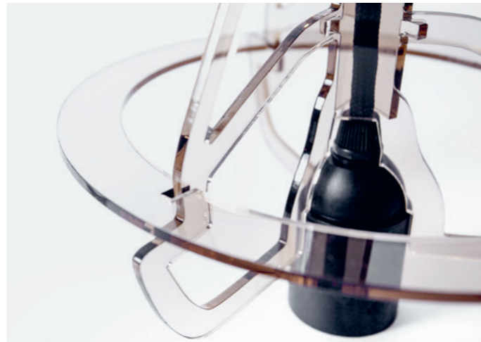
Aus Plexiglas fertigte die Studentin mit einer CNC-Fräsmaschine eine neue Aufhängung – ohne mechanische oder klebende Verbindungen.