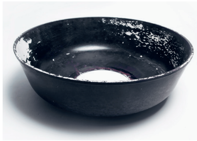
Als Grundlage für das Reparaturprojekt einer Architekturstudentin diente ein alter Soft-Light-Reflektor.