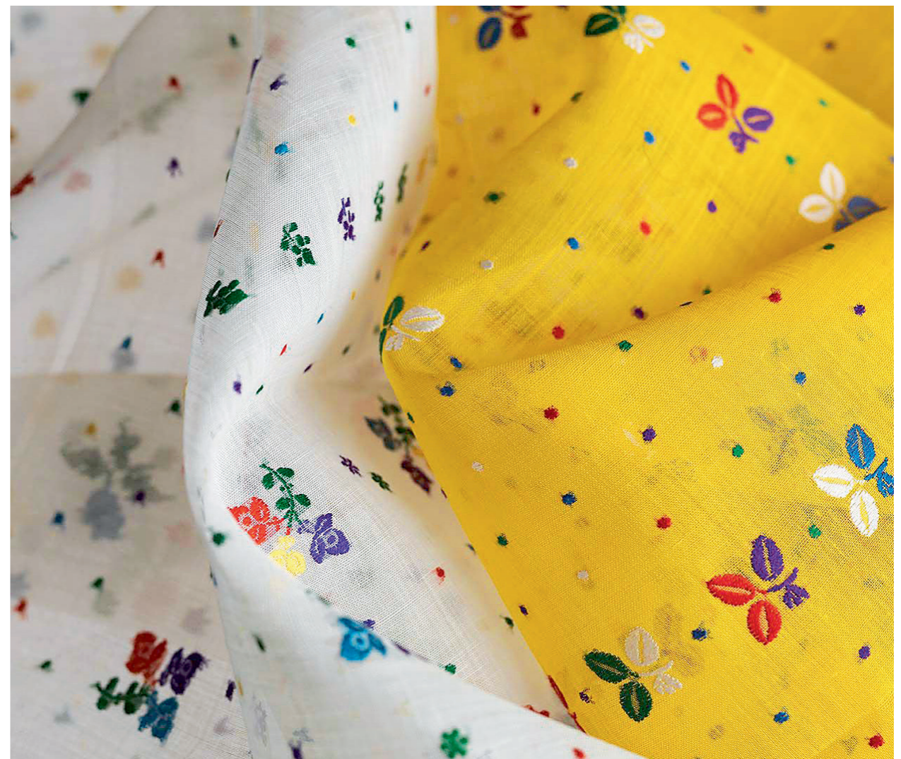
Abb. 2: Plattstichwebererei der Gebrüder Schefer, Speicher, 1880–1900. Exportiert werden die Gewebe vorwiegend in die USA, nach Grossbritannien und Britisch-Indien. Für Indien speziell gefertigt werden leuchtende Sari-Stoffe mit bunten Streublumenmustern.