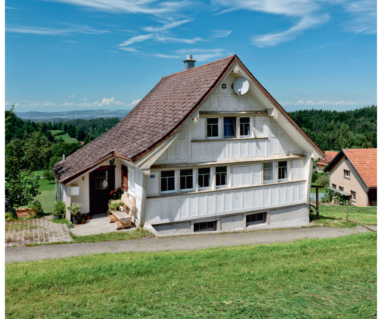
Abb. 1: Weberhöckli im Mätteli ob dem Schwänberg in Herisau, erbaut 1838. Gewoben wird im Keller. Die gesundheitlichen Folgen des feuchten Arbeitsplatzes sind schwerwiegend. Bei der Rekrutierung 1892 sind die Hälfte der militärpflichtigen Männer wegen Herzkrankheiten, Kropferscheinungen, Augenleiden, Kleinwüchsigkeit und Blutar- tumentauglichkeit 4 .