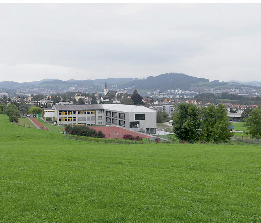
Agglomeration als Durchdringung in Abtwil (SG): Historische Gebäude und charakteristische Landschaftselemente bilden gleichermaßen visuelle Anker innerhalb eines heterogenen Gemenges. Solche Ankerpunkte würde eine landschaftsbezogene Planung in Wert setzen.

jedoch die Frage sein: Wie wird Agglomeration wahrgenommen und erlebt? Wie wird sie tagtäglich gemacht?