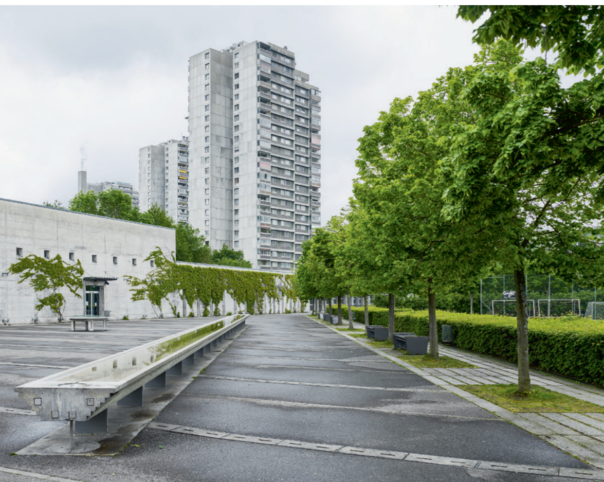
Die Aussenanlage der Französischen Schule in Bern: Der Schweizer Landschaftsarchitekt Dieter Kienast erwirkte hier in den 1980er-Jahren eine ästhetische Fürsorge für einen Agglomerationsraum, der von der Wohnsiedlung Bern Murifeld, einer Autobahn, Kleingärtenkolonien und Resten von Obstbaumwiesen geprägt ist. Der Eingriff ist mosaikartig, die Gestaltung bringt die disparaten Landschaftsteile zusammen und gibt den Schülern einen Aussenraum, den sie unterschiedlich nutzen können. (Büro Stöckli + Kienast / Stöckli, Kienast & Köppel, 1983–1991).