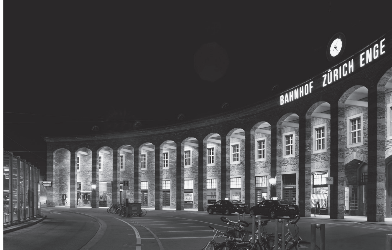
Beleuchtung Tessinerplatz und Bahnhof Enge.

Energieverbrauch und Unterhalt sparsame Technologien wie die LED (Light Emitting Diode) verleihen der Entwicklung zusätzlich Schub.