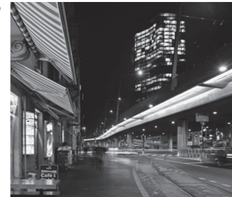
LED-Beleuchtung der sanierten Hardbrücke im Entwicklungsgebiet Zürich West.

chenbeleuchtungen. Das 2007 im Rahmen eines vom Bund unterstützten KTI-Forschungsprojekts entwickelte Lichtprojektionsverfahren für Gebäude- und Kirchenbeleuchtungen von Huber + Steiger aus Zürich sei als Beispiel für eine neue Technologie genannt. Bei diesem Verfahren werden verzugs-korrigierte Bildvorlagen an Fassaden projiziert, so dass Fensteröffnungen und der Nachthimmel ausgespart werden können. Der Energieverbrauch ist bei diesem Verfahren im Vergleich zu konventionellen Fassadenbeleuchtungstechnologien um ein Mehrfaches geringer. So musste für die rund 500 Meter lange Beleuchtung der seeseitigen Gebäudefassaden am Utoquai