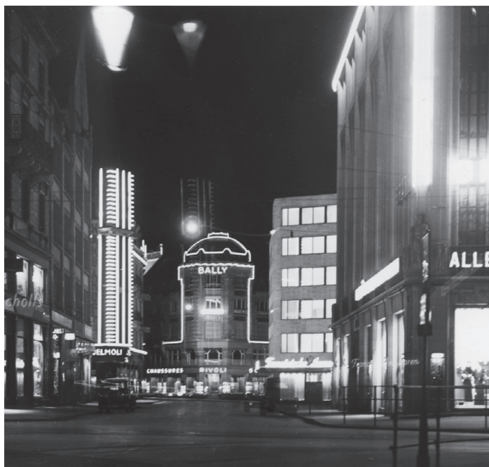
Lichtwoche Zürich 1932.

Die Aussenbeleuchtung war lange Zeit kein Thema im Städtebau. Erst mit der Industrialisierung wurde die Beleuchtung wichtiger Verkehrswege zu einer öffentlichen Aufgabe. Durch die Inbetriebnahme der Gaslampe zu Beginn des 19. Jahrhunderts erfolgte ein erster technologischer Meilenstein in der Entwicklung der Stadtbeleuchtung. Mit der Erfindung der elektrisch betriebenen Lichtbogenlampe Mitte des 19. Jahrhunderts und nach Edisons Erfindung der Glühlampe erfuhr der Einsatz von Kunstlicht dann eine eigentliche Boom-Phase. Die Faszination, die von der neuen Technik ausging, war enorm und kannte kaum Grenzen. Weltausstellungen wie 1878 in Paris oder 1893 in Chicago zelebrierten den technischen Fortschritt und setzten das Kunstlicht gestalterisch spektakulär in Szene. In den 1920er- und anfangs der 30er-Jahre veranstalteten viele Städte in Amerika und Europa temporäre Beleuchtungsaktionen. In Zürich beein-