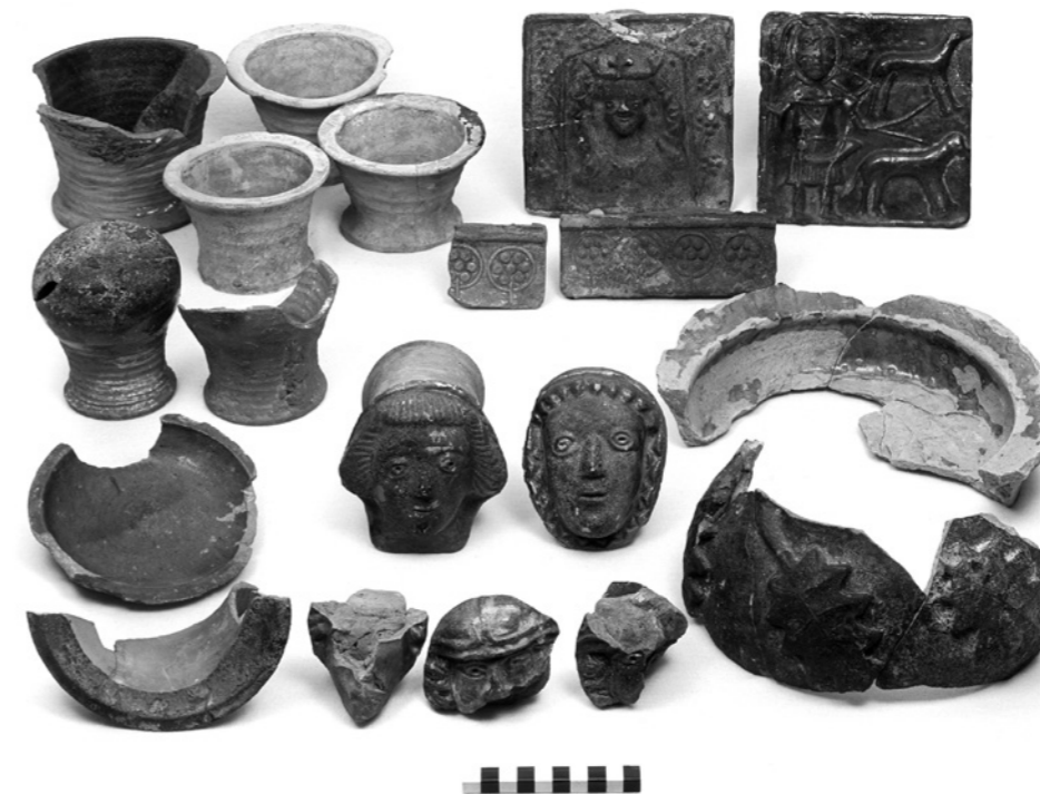
Abb. 5: Auswil, Burgruine Rohrberg, Fundensemble mit Napf-, Pilz-, Teller-, Gesims- und Blattkacheln sowie einem Ofenaufsatz. Aufbewahrungsort Bernisches Historisches Museum.

Eva Roth Heege. Ofenkeramik und Kachelöfen. Typologie, Terminologie und Rekonstruktion im deutschsprachigen Raum (CH, D, A, FL) mit einem Glossar in siebzehn Sprachen. (Schweizer Beiträge zur Kulturgeschichte und Archäologie des Mittelalters 39), Basel 2012.