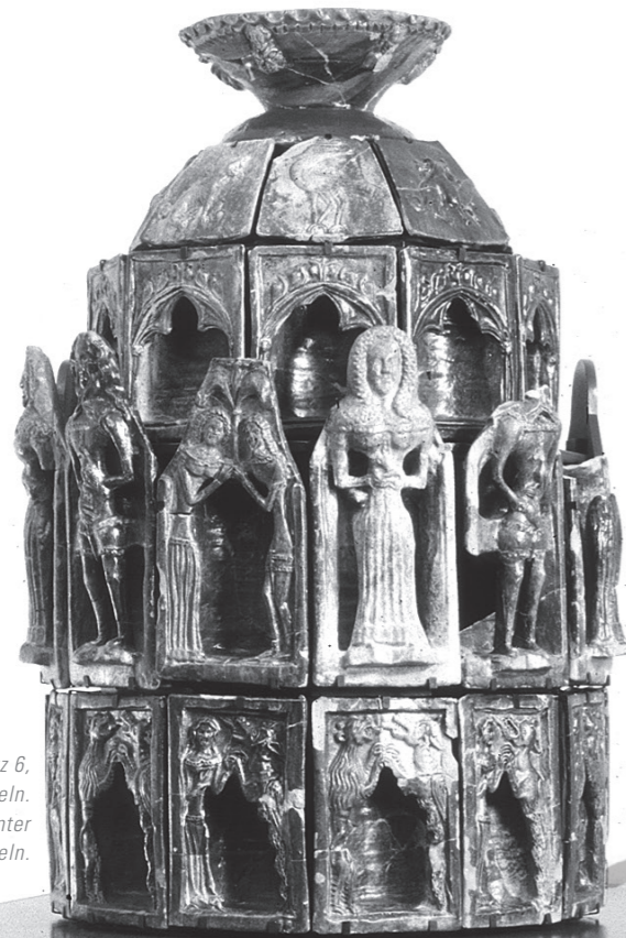
Abb. 1: Chur, Martinsplatz 6, Depotfund von Ofenkacheln. Rekonstruktion des Ofens unter Verwendung der Originalkacheln.