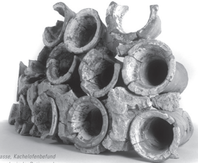
Abb. 2: Winterthur, Metzggasse, Kachelofenbefund von 1208 (dendrochronologische Datierung). Rekonstruktion der Ofenkuppel mit Originalkacheln und zugehörigem Ofenlehm.

Mit der Beherrschung des Feuers begann der Mensch aktiv auf seine Umwelt einzuwirken. Das Feuer ermöglichte nicht nur andere Formen der Nahrungszubereitung, sondern erlaubte auch die permanente Besiedlung von Regionen, die ohne die Wärme des Feuers unbewohnbar wären. Dabei war es ein weiter Weg von der offenen Feuerstelle zu den ausgefeilten technischen Innovationen der Hypokaust-Heissluftheizung der Römer, den davon abgeleiteten klösterlichen Heissluft-Kanalheizungen des Früh- und Hochmittelalters, den Steinspeicher-Warmluftheizungen in Klöstern, Burgen und Rathäusern des Hoch- und Spätmittelalters sowie den Stuben- und Kachelöfen des Spätmittelalters und der Neuzeit bis zur Zentralheizung und der heutigen Nutzung von Erdwärme oder anderen Energiequellen.