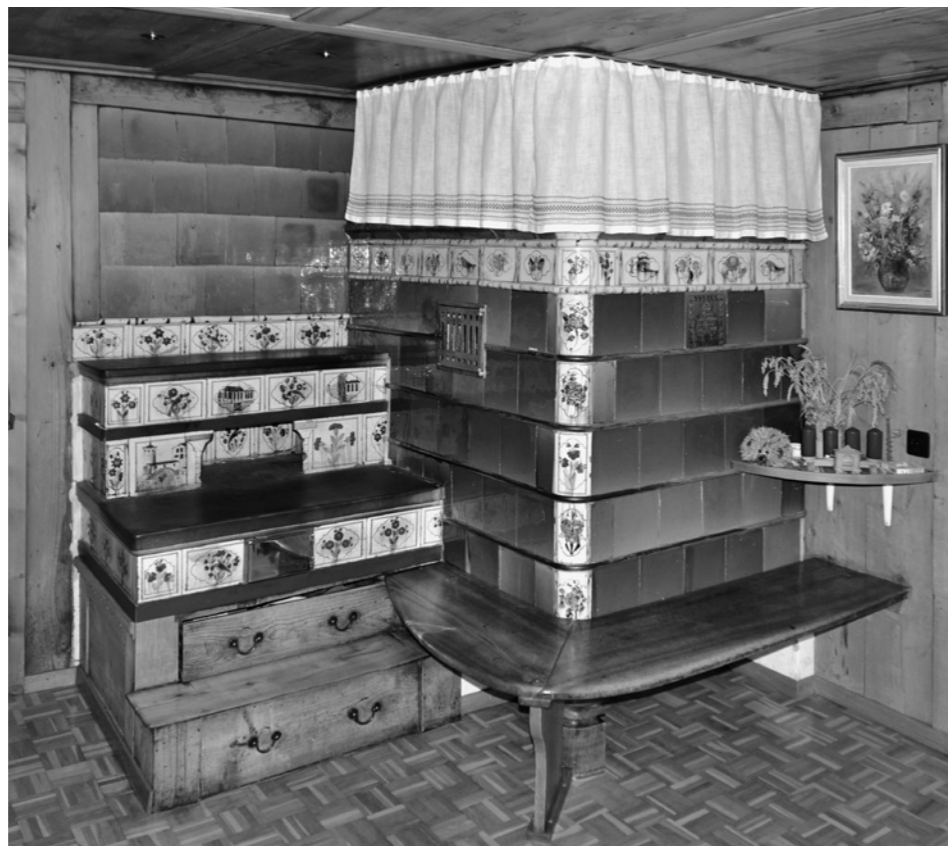
Abb. 4: Boswil, Privathaus, Kachelofen aus der Werkstatt des Hafners Heinrich Notter aus Boswil, datiert 1831.

Jahrhundert Gesims-, Eck- und Blattkacheln, deren reliefierte Bildflächen in der Grösse aufeinander abgestimmt sind. Der achteckige Turmaufbau schliesst oben mit Hängeleisten und Bekrönungskacheln mit Leistenzarge ab.