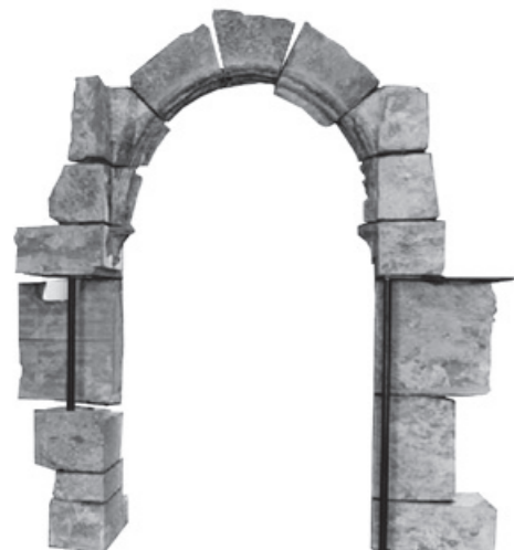
Bern, Historisches Muesum Bern, Ausstellung «Bilderstrum, Wahnsinn oder Gottes Wille?» 2000.

nahme von Portalen oder Arkadenreihen als pittoreske Staffage geeignet schienen, boten sich die damals neu entstehenden Museen und kulturhistorischen Sammlungen an. Museal ausgestellt sollten die steinernen Geschichtszeugnisse sowohl eine Vorstellung von der Baukunst vergangener Zeiten vermitteln als auch als Lehrmaterial für Künstler und Handwerker dienen. Die praktische Umsetzung solcher Ideen erwies sich allerdings als problematisch. In Konkurrenz zu anderen Kunstwerken konnten die häufig mit seriell wirkenden Ornamentformen dekorierten Baufragmente nicht bestehen. Eine Entwicklungsreihe von Kapitell- oder Fensterformen liess sich zudem durch Gipsabgüsse oder in Gestalt von Abbildungen in einem Buch sehr viel einfacher vor Augen führen. Man griff deshalb auch im Museum zumeist auf die Idee einer Wiederverwendung einzelner Bauteile zurück und setzte auf die Schaffung von mehr oder weniger wirklichkeitsnahen Erlebnisräumen. Im als Kreuzgang bezeichneten Saal des Zürcher Landesmuseums stammen die Maßwerkfenster aus dem Barfüsserkloster, die Arkadenreihe der gegenüberliegenden Wand aus dem ehemaligen Dominikanerkloster (beide in Zürich). Obwohl Überarbeitungen dazu führten, dass die historischen Teile im geschlossenen Erscheinungsbild des Raumes verschwinden, betonte Museumsdirektor Heinrich Angst deren Bedeutung im Bestreben «ein möglichst getreues und namentlich für das grosse Publikum verständliches Bild vergangener Zeiten zu geben».