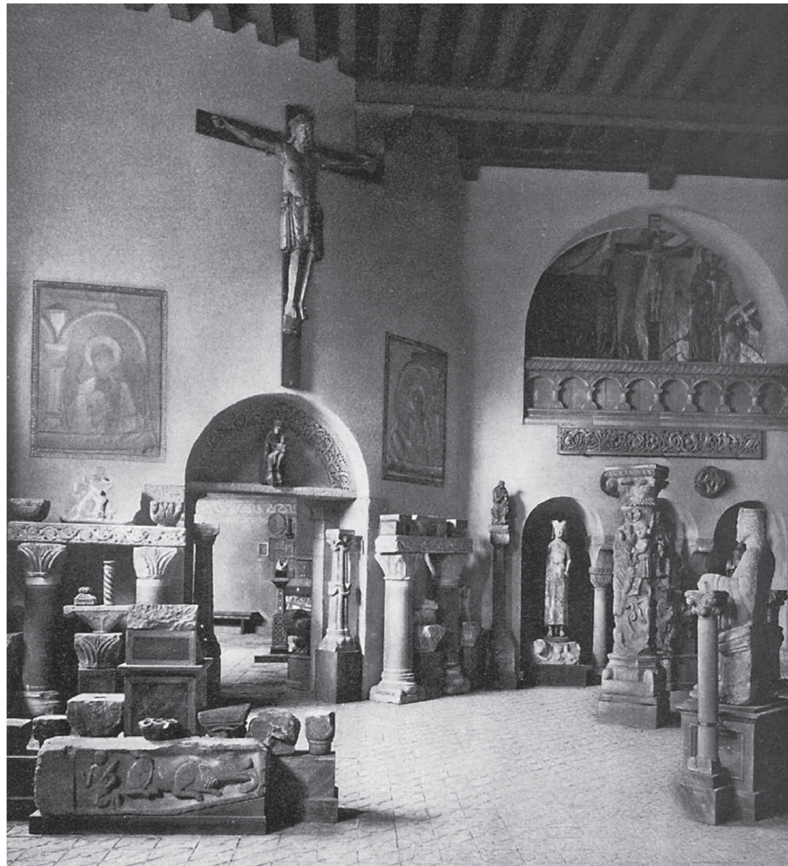
München, Bayerisches Nationalmuseum, Romanisches Lapidarium (Saal 5), um 1902.

Sammlungsräume zu gestalten und die auf Reisen lieb gewonnene Atmosphäre der Alten Welt in die Neue zu übertragen. Ein Besuch des venezianischen Innenhofs von Gardner's 1903 eröffnetem Privatmuseum ist noch heute ein beeindruckendes Erlebnis. Allerdings zögerten die grossen Museen zunächst, diesem Beispiel zu folgen. Der amerikanische Bildhauer George Grey Barnard konnte seine in Frankreich erworbenen Kreuzgänge nach dem kostspieligen Transport in die USA 1913 nicht wie gehofft direkt weiterverkaufen. Erst nachdem er seine Sammlung in einem eigens errichteten Bau in New York präsentierte, änderte sich die Situation. Der enorme Publikumserfolg von Barnard's «The Cloisters» basierte nicht auf einer originalgetreuen Rekonstruktion der ursprünglichen Anlagen, sondern auf einer sinnlich erlebbaren Evokation des Mittelalters durch die Inszenierung verschiedener Teilräume eines Sakralbaus. Ein als Mönch verkleideter Wärter und dämmriges Licht vervollständigten die Illusion. Trotz kritischer Stimmen entdeckten die amerikanischen Museumsverantwortlichen in der Folge die Präsentation von Kunst in einem stilistisch passenden