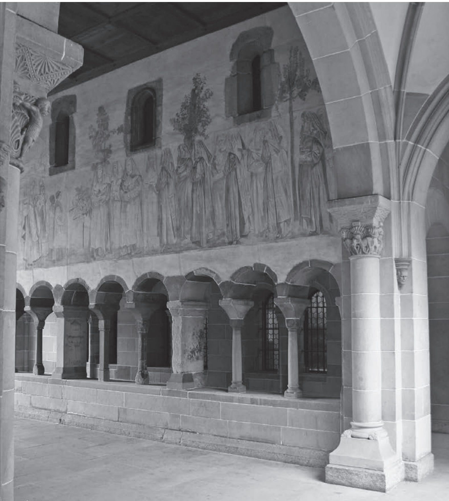
Zürich, Fraumünsterkreuzgang, Durchgang von Osten mit den romanischen Arkaden des ursprünglichen Kreuzgangs.