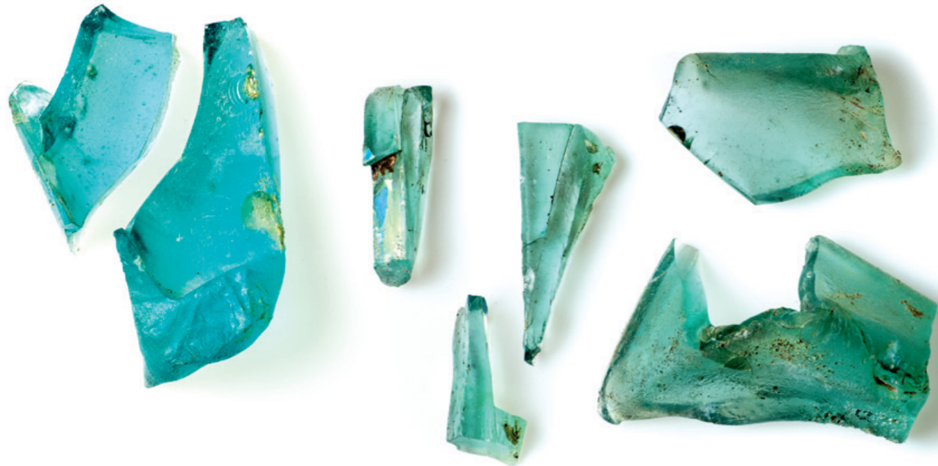
Zersplittertes Altglas, Reste eines ursprünglich vierkantigen Krugs aus Augst.