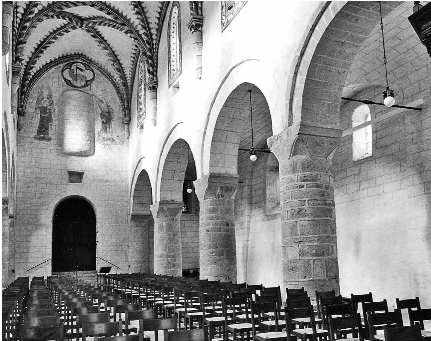
...und Inneres der Kirche von Romainmôtier.

...und Inneres der Kirche von Romainmôtier. rung erfolgen. Am 25. August hat das Eidgenössische Departement des Innern EDI die Anhörung der «Botschaft zur Kulturförderung für die Jahre 2012–2015» eröffnet. Diese sogenannte Kulturbotschaft legt die Ziele, Massnahmen und Kredite für alle kulturellen Institutionen des Bundes fest. Die interessierten Kreise wurden eingeladen, bis zum 24. November 2010 Stellung zum Entwurf der Kulturbotschaft zu nehmen. Danach wird die Botschaft überarbeitet und im Februar 2011 dem Bundesrat zur Genehmigung unterbreitet. Im Verlauf des Jahres soll sie dann vom Parlament beraten und Ende 2011 von den Räten verabschiedet werden. Am 1. Januar 2012 treten die Botschaft und das Kulturförderungsgesetz in Kraft.