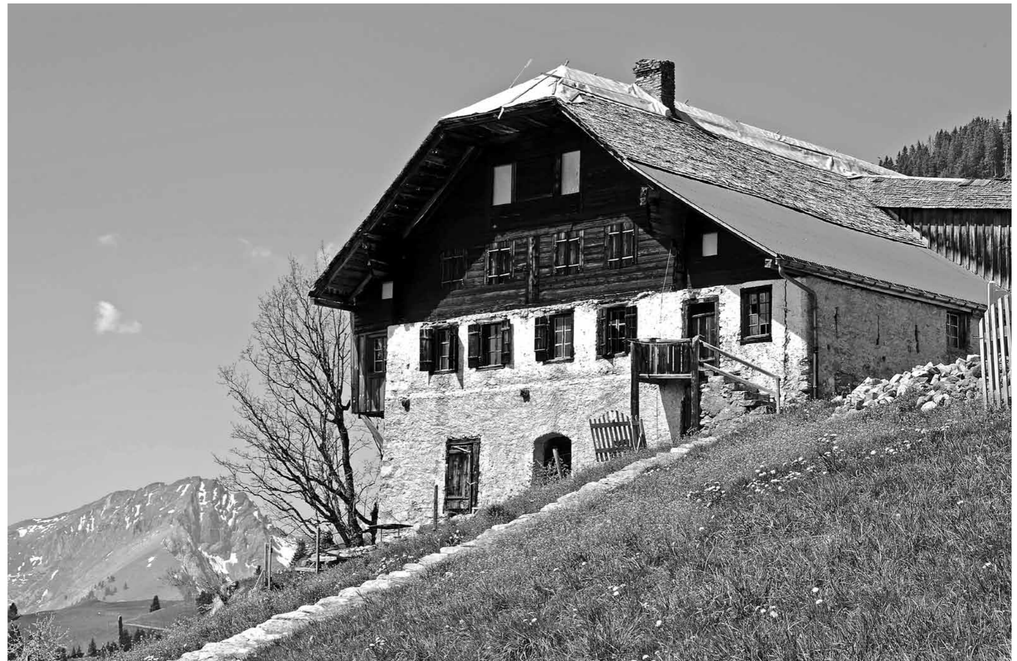
...Chalet in Rossinière...

Ab 2012 soll die Finanzierung von Heimatschutz und Denkmalpflege in einem Schwerpunktprogramm zur Kulturförde-