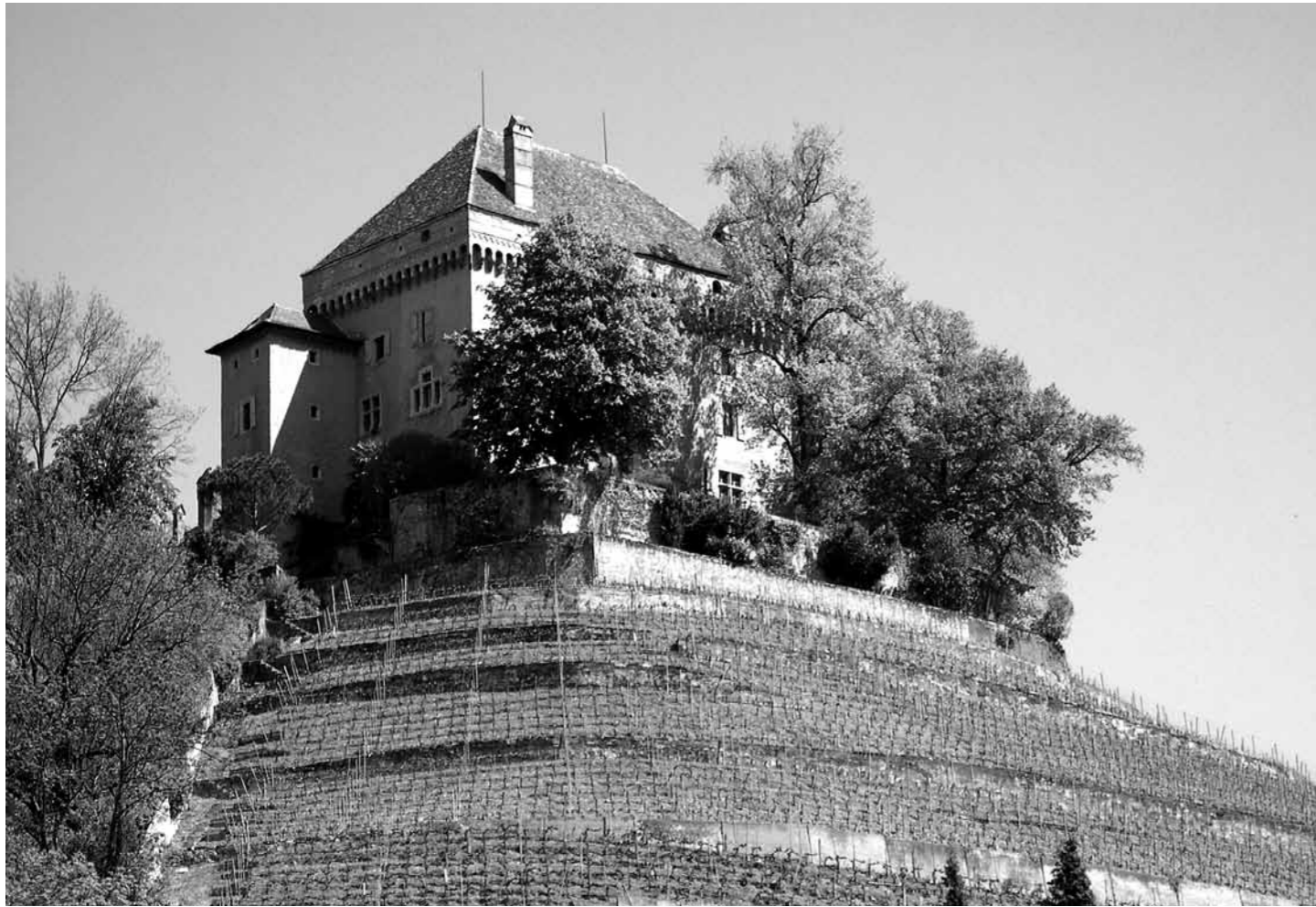
...Château du Châtelard in Clarens...

sation du public à laquelle est parvenue la campagne du Conseil de l'Europe, cette idée doit aussi être nourrie par des concepts théoriques et par des actions de coopération concrètes sur le terrain. Car cet héritage constitue l'un des principaux atouts de l'Europe, non seulement comme témoignage de la richesse de son histoire, mais aussi et surtout comme reflet de sa capacité à créer, reflet du génie et du talent de ses artisans, de ses artistes, de ses créateurs, qui ont toujours su ignorer les frontières, qui ont toujours considéré la culture comme un échange.»