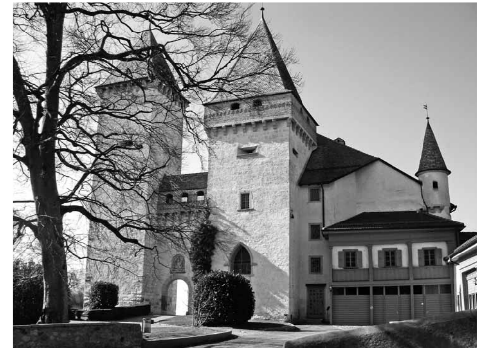
...Schloss von La Sarraz...

Heute erwarten uns neue Herausforderungen. Der Klimawandel bewirkt allerorten Massnahmen zur energetischen Verbesserung von Gebäuden. Auch die Spitzenorganisationen der Denkmalpflege in Deutschland befürworten grundsätzlich die Notwendigkeit einer massvollen