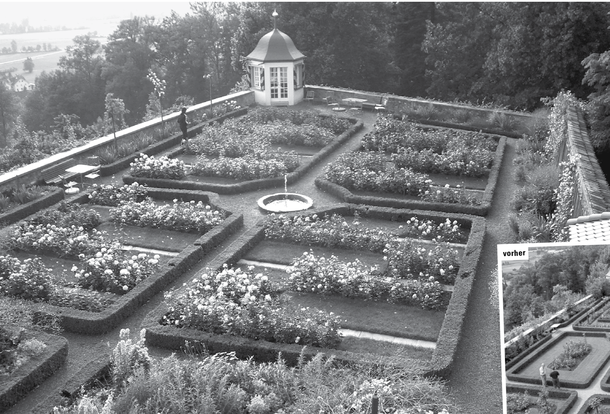
Der Potager (heute Rosengarten) auf Schloss Heidegg (LU) nach dem gartendenkmalpflegerischen Eingriff.