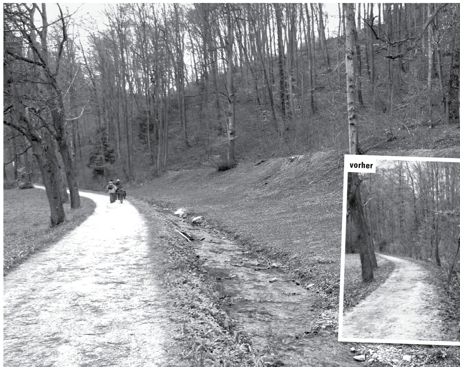
Der Landschaftsgarten in der Eremitage Arlesheim (BL) nach der denkmalpflegerischen Umgestaltung.

Weil öffentliche Aufmerksamkeit, Zuspruch und Nachfrage existenzsichernd sind, kann auch der Tourismus eine wichtige Rolle bei der Sicherung und Pflege der historischen Gärten spielen. Hier eröffnet