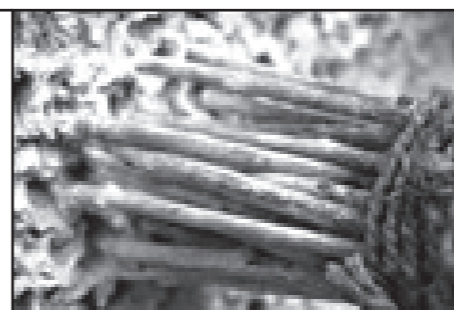
Das Stippwerkzeug aus zusammengebundenen Holzstäbchen.

Der Stippputz entsteht durch das Eindrücken eines «Stempels» (zusammengebundene Holzstäbchen, oder auch andere Materialien) in den frisch angetragenen Verputz. Dies zieht eine charakteristische Struktur nach sich, welche sich in der Schweiz nur selten findet. Die Methode des Stippens ist, als aufwändige Technik, welche viel Handarbeit bedeutet, in Vergessenheit geraten. Deshalb ist diese Verputzart heute nur wenig bekannt und es können auch keine gebrauchsfertigen Stippwerkzeuge im Handel erworben werden. Dies veranlasste uns dazu, zunächst ein solches Werkzeug aus Zweigen unregelmässiger Grösse anzufertigen und auf Probestellen anzuwenden. Nach einigen Anpassungen konnte dann die gewünschte Oberflächenstruktur erreicht werden.