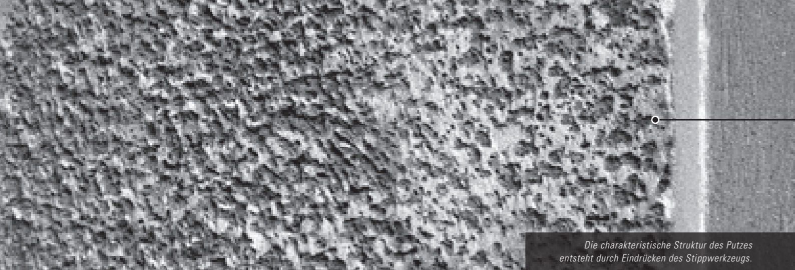
Die charakteristische Struktur des Putzes entsteht durch Eindrücken des Stippwerkzeugs.