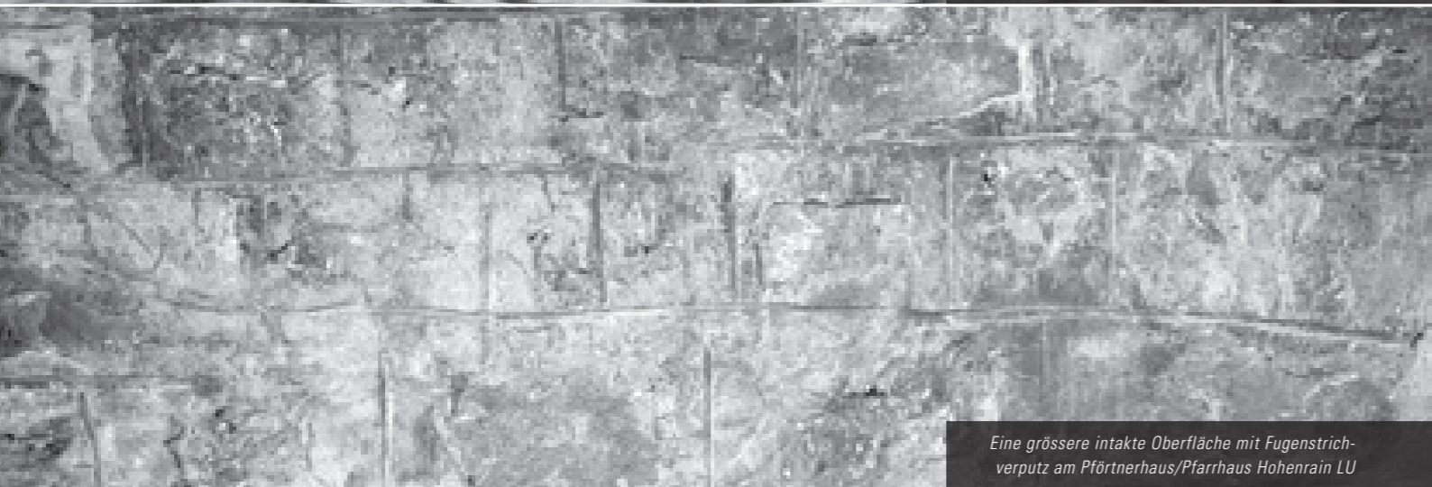
Eine grössere intakte Oberfläche mit Fugenstrichverputz am Pförtnerhaus/Pfarrhaus Hohenrain LU

Die vor über 100 Jahren als Pionierwerk der Eisenbahnarchitektur in St. Gallen errichtete Lokremise gehört national zu den Betonpionierbauten. Im Bereich der Verputzoberflächen an der im Jugendstil gestalteten Fassade wurden grosse Aufwendungen erbracht um spezielle, der Architektur angepasste Verputzoberflächen zu schaffen. An diesem Objekt finden sich einerseits wellenförmige Zierfriese und andererseits grosse Flächen von Stippputz.