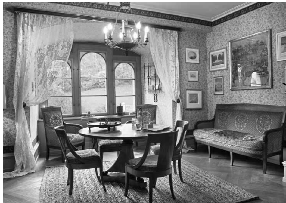
Abb. 3: Schloss Neu-Bechburg, «Neubau»-Zimmer, um 1890–1900. Wiedereinrichtung Thomas Loertscher, 2008.

schiedlich dicken Lackschicht verschwindet (Abb. 1). Die dunkle Farbe rührt vom Alterungsprozess des Firnisses und der Beimengung von Staub- und Schmutzpartikeln her. Während hier auch die glatten Flächen von einer schützenden Lack- oder mindestens Wachsschicht bedeckt bleiben, erscheint beim Silbergefäß das reine, ungeschützte Grundmaterial des Edelmetalls. Beiden Objekten gemeinsam ist der Wechsel zwischen glatten und strukturierten Flächen, die in unterschiedlicher Weise der regelmässigen Reinigungs- und Polierpflege ausgesetzt sind. Bei beiden erhöht der lebendige Wechsel zwischen helleren Glanz- und dunkleren Mattpartien die spezifischen Wirkungen der künstlerischen Gestaltungsweise.