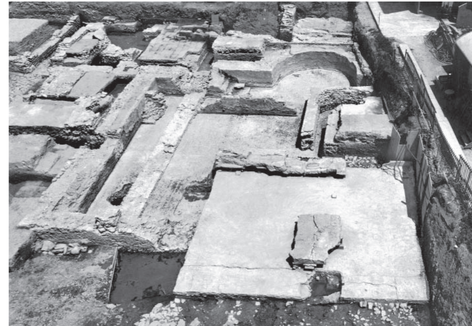
Avenches, thermes de l'insula 19. La piscine à abside de l'époque tibérienne, dont le fond était revêtu d'un opus spicatum dans un état de conservation exceptionnel, est surmontée par des structures en lien avec les phases postérieures des bains.