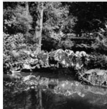
Abb. 3: Zyklopenbrücke im Arboretum.

bächleins und Teile des einstigen Alpinums (Steingarten). Den aareseitigen Abschluss dieses Landschaftsparks bildete der Industrikanal, der im Jahr 2003 von zwei später eingefügten Dämmen befreit wurde. Gleichzeitig liessen die heutigen Besitzer die «eiserne Brücke», die früher die beiden Ufer miteinander verband, wieder errichten.