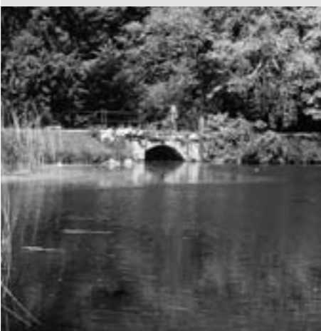
Abb. 5: Die Steinbrücke, die den Grossen Weiher vom Schlittschuhweiher trennt.