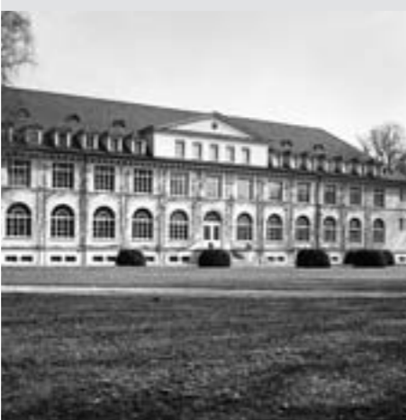
Abb. 6: Das Kosthaus, erbaut von Karl Moser im Jahr 1919.

der Gesellschaft dieser Zeit, die auch in der Kunst und Architektur bewusst auf die Wurzeln einer eigenen Geschichte zurückgreift.