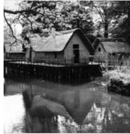
Abb. 2: Das Pfahlbaudorf, in den Jahren 1888–1890 errichtet nach einem unter Anleitung des Zürcher Gelehrten Ferdinand Keller gebauten Modells des Uhrmachers Maximilian Götzingers aus Basel (Massstab 1:2).

Heute befindet sich der nordseitige Eingang zum Park beim Kosthaus. Der Weg nach links führt zu dem nur noch rudimentär erhaltenen Teil der Alten Anlagen zwischen dem einstigen Kanal und der Bahnlinie. Noch deutlich erkennbar sind einige ursprüngliche Gestaltungselemente wie der Mittlere und der Obere, gegenwärtig trockenliegende Weiher, die Rinne des Wald-