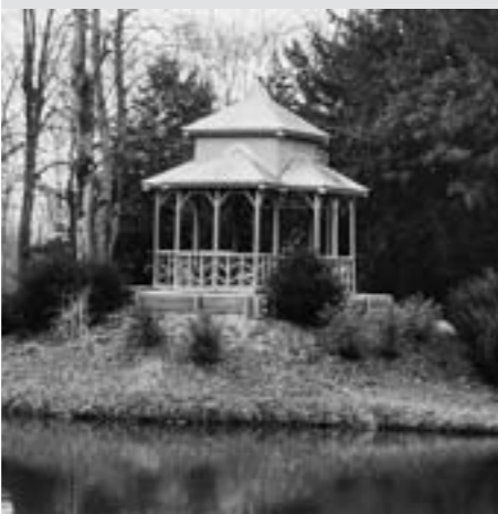
Abb. 4: Der Chinesische Pavillon, errichtet auf einem künstlich angelegten Hügel.