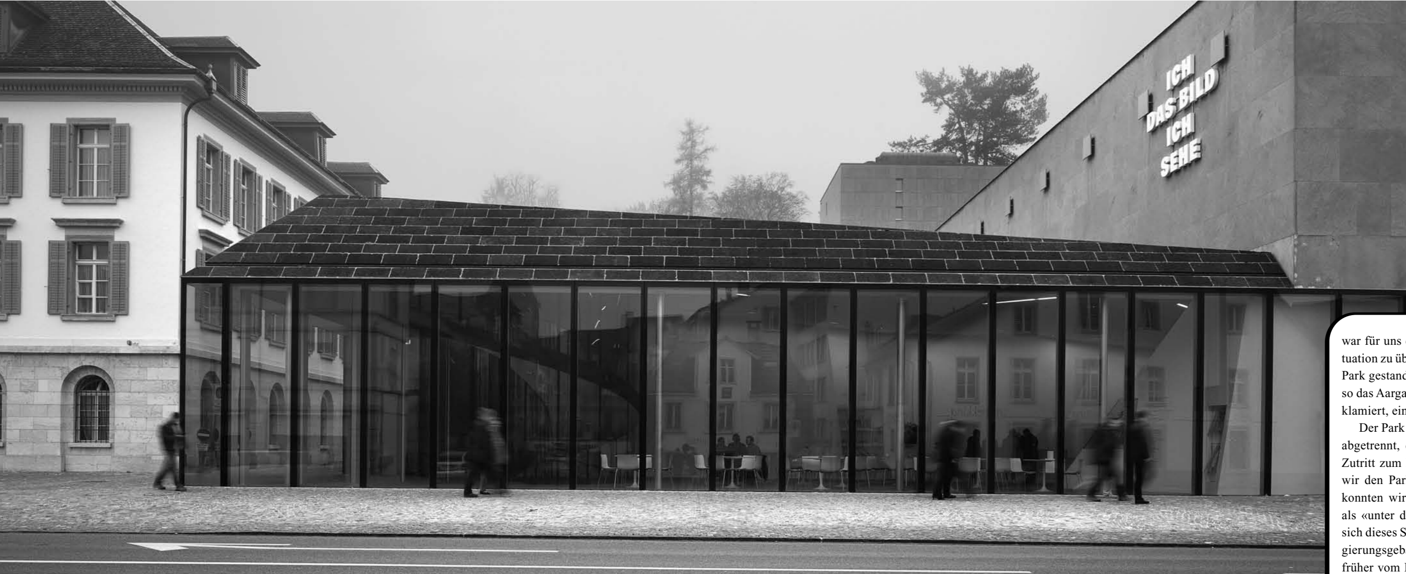
Der Erweiterungsbau des Aargauer Kunsthauses zeugt von einem respektvollen Umgang mit dem Gebäude aus den 1950er-Jahren.